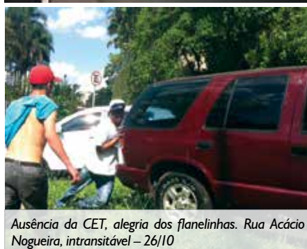
Ausência da CET, alegria dos flanelinhas. Rua Acácio Nogueira, intransitável - 26/10