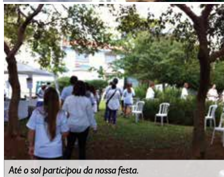
Até o sol participou da nossa festa.