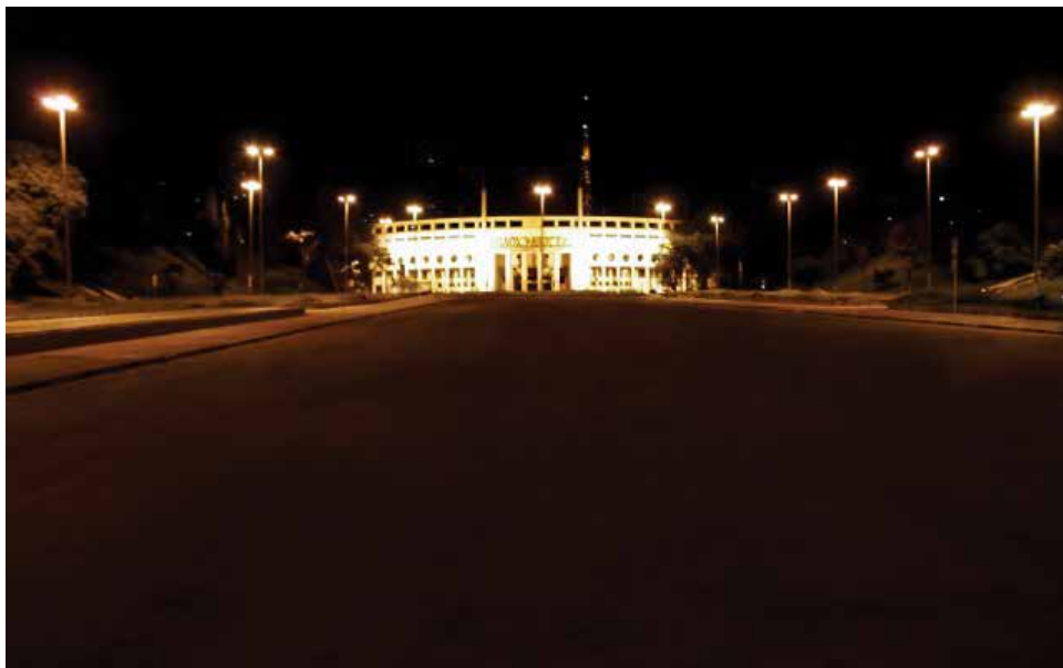
Vamos manter acesas as luzes do nosso Estádio

Um dos ícones da Pauliceia é o Estádio Paulo Machado de Carvalho. Tão significativo é que até na chamada da novela das 21h da Globo, para identificar São Paulo, o Pacaembu aparece em destaque. Independente da torcida ou do engajamento esportivo, não há quem não o conheça e tenha orgulho dele. É, sim, um patrimônio da população, da cidade e do país!